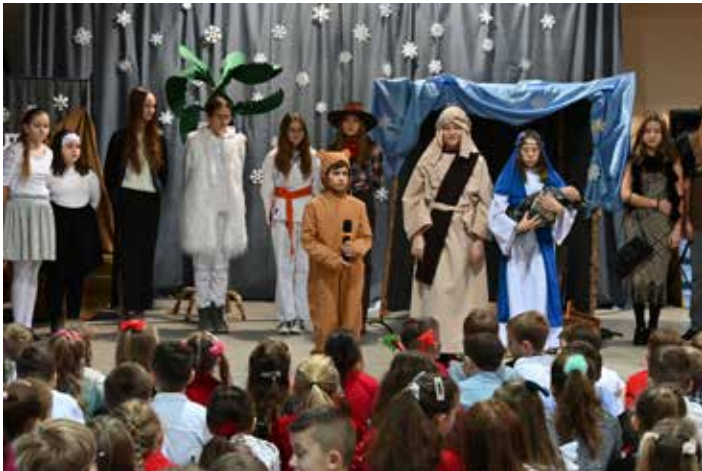
Na szkolnej scenie