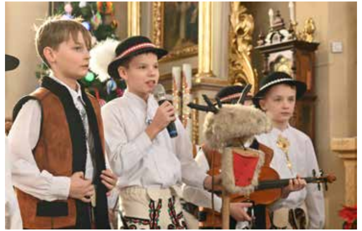
W strojach regionalnych wystąpili chłopcy z kl. III i kl. V.