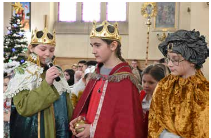
Mędrycy ze Wschodu. Ich rolę kreowały uczennice z naszej klasy szóstej.