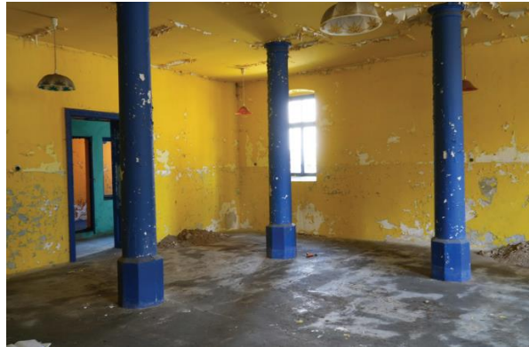
Dawna synagoga w Czarnym Dunajcu przed remontem